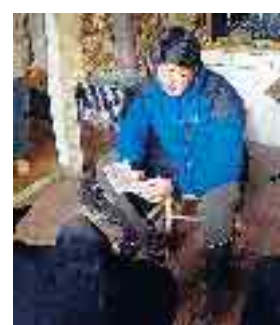
Due immagini dello scrittore e giornalista Davide Sapienza