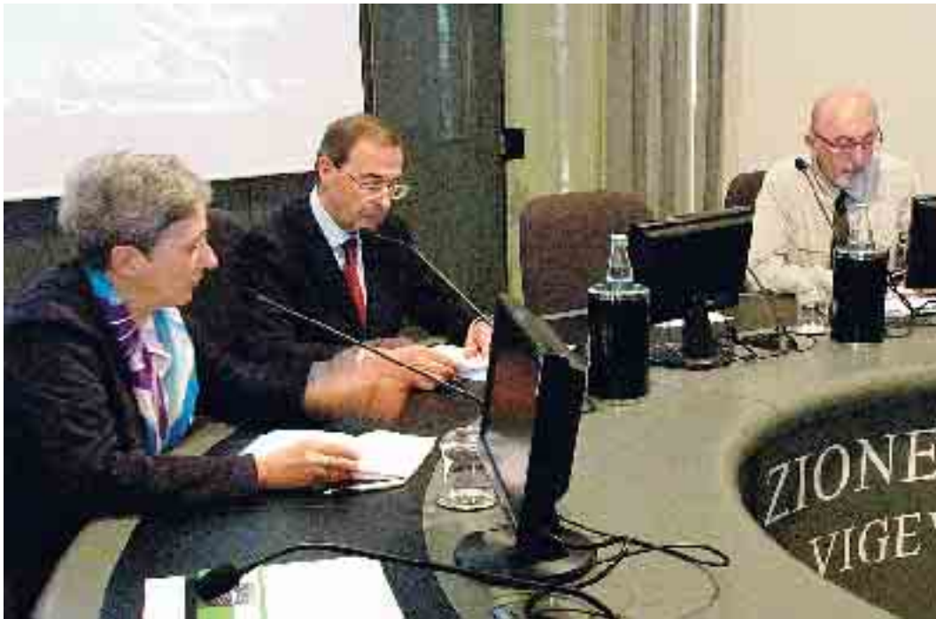
Due momenti della presentazione della guida "Route 45: la Val Trebbia" in Fondazione

L'architetto si è soffermato sul ruolo che in passato avevano le strade: «Ho la sensazione che oggi abbiano rinunciato a